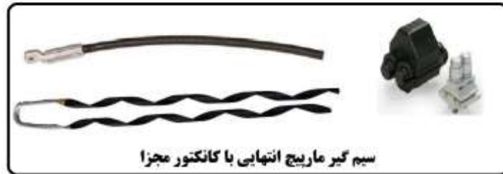
سیم‌گیر ماریچج انتهایی با کانکتور مجزا