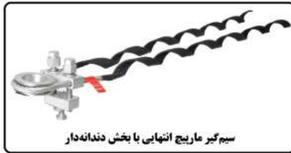
سیم‌گیر ماریچج انتهایی با بخش دنداندار

پیوست (۳): تصویر یک نمونه سیم‌گیر ماریچج انتهایی هادی‌های روکش‌دار فشار متوسط و یراق رابط آن با مقره