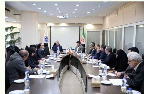
در نخستین نشست کمیته مشترک ایران و لبنان مطرح شد