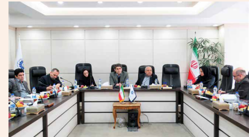
در نشست کارگروه کارشناسی شورای گفت‌وگو مطرح شد

۱/۵ برابر هزینه کالای وارداتی، سرمایه‌گذاری کند. وی ادامه داد: در این تبصره آمده که بانک‌ها ۳۵ درصد در حواله ارزی وثیقه دریافت کنند، اما روال بانک‌ها بدین شکل است که یا باید ۳۵ درصد در حساب سپرده جاری گذاشته شود که سودی به آن تعلق نمی‌گیرد و یا باید ۴۵ درصد در حسابی سپرده شود که مشمول سود است. در حالی که این امر در مجموعه مقررات ارزی ذکر نشده است. بنابراین با این سیاست‌ها و رویه‌ها قیمت تمام شده کالا افزایش می‌یابد و هزینه آن را تاجر باید بپردازد. این فعال اقتصادی در بخش دیگری از سخنان خود، گفت: قبض انبار به معنای تخلیه بار در گمرک است اما بانک‌ها طبق این بند تنها برگه سبز را می‌پذیرند. در حالی که برگ سبز بعد از یک ماه تا ۴۰ روز که کالا وارد و آزمایش‌های لازم انجام شد و تسویه صورت گرفت، صادر می‌شود. در اینجا هم هزینه اضافه به واردکننده تحمیل می‌شود. در طول این مدت بانک کل سپرده را نزد خود نگه می‌دارد.