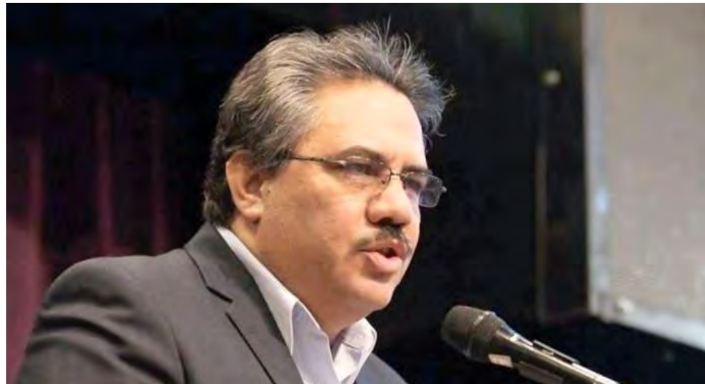
سرپرست سازمان توسعه تجارت خبر داد؛