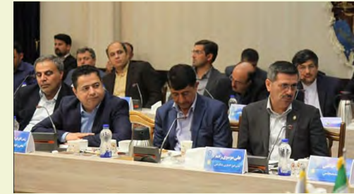
رئیس اتاق اردبیل در جلسه شورای هماهنگی بانک‌های کشور