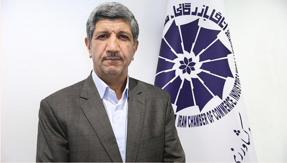
با حکم غلامحسین شافعی