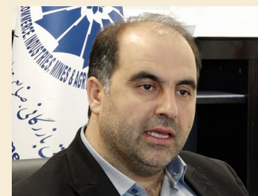
غلامحسین جمیلی در گفت‌وگو با پایگاه خبری اتاق ایران