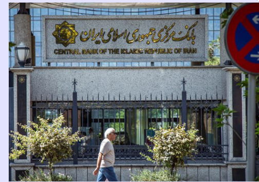
یادداشت مشاور سابق اوفک

اما تحریم جدید چگونه عمل خواهد کرد؟ در سال ۲۰۰۰ قانونی تحت عنوان «قانون اصلاح تحریم‌ها و افزایش صادرات» در کنگره آمریکا به تصویب رسید که به موجب آن دفتر کنترل دارایی‌های خارجی (اوفک) موظف شد برخی اقلام بشردوستانه (غذا، دارو و لوازم پزشکی) را از برنامه تحریم کشورهای تحت تحریم آمریکا از جمله ایران حذف کند. در ارتباط با تحریم‌های ایران، این کار از طریق صدور مجوزهای عمومی (معافیت) انجام می‌شود و در قالب آن هیچ فرد یا نهاد ایرانی که ذیل تحریم‌های مبارزه با تروریسم قرار داشته باشد، نمی‌تواند از این معافیت استفاده کند.