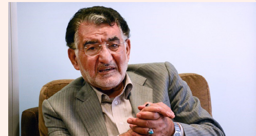
«عیار ۱۵» روابط تجاری ایران و عراق «یک‌طرفه» است