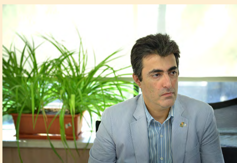
عضو هیات نمایندگان اتاق تهران

این عضو هیات نمایندگان اتاق تهران می گوید: «مقررات زدایی، کاهش ارتباط مستقیم مردم با سیستم های دولتی و دیوان سالاری اداری حاکم بر سازمان هایی چون شهرداری، تامین اجتماعی، امور مالیاتی و غیره، حذف قوانین حمایتی و کنترل ها و نظارت های غیربازاری مانند قیمت گذاری، بسترسازی و تسهیل در تجارت و کنش ها و واکنش های عرضه و تقاضا، اجازه شکوفایی و رشد اقتصادی و در نتیجه کاهش فساد را می دهد. همه با هم باید در مسیر آزادسازی اقتصادی، خصوصی سازی و مبارزه با فساد سیستماتیک گام برداریم.»