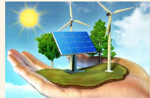
با هدف مدیریت انرژی در بخش کشاورزی و کاهش انتشار گازهای گلخانه‌ای؛

وی با بیان اینکه قراردادهایی در وزارت نفت در این باره منعقد شده، اما این موضوع به شورای