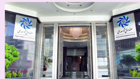
بررسی «پایگاه خبری اتاق ایران» از عملکرد صندوق توسعه در ۹ ماهه سال ۹۷