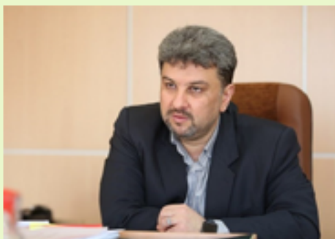
در هفته جاری