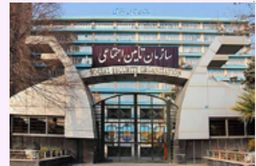
معاون کسب و کار اتاق تهران از مصوبه جدید هیات وزیران خبر داد