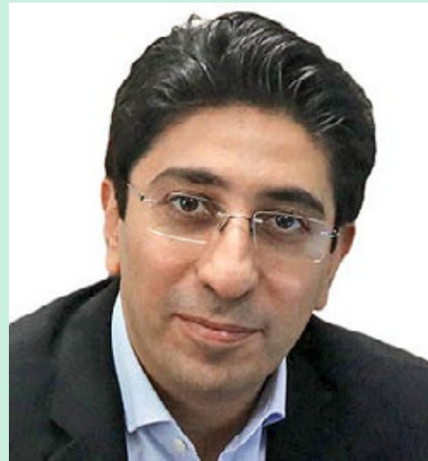
دبیرسندیکای صنعت برق ایران:

فرصتی به نام نرخ بهره دارد. پس باید همبستگی میان نرخ بهره و پول منفی باشد. اگر شما متغیری را به عنوان پول در نظر گرفته‌اید و رابطه آن با نرخ