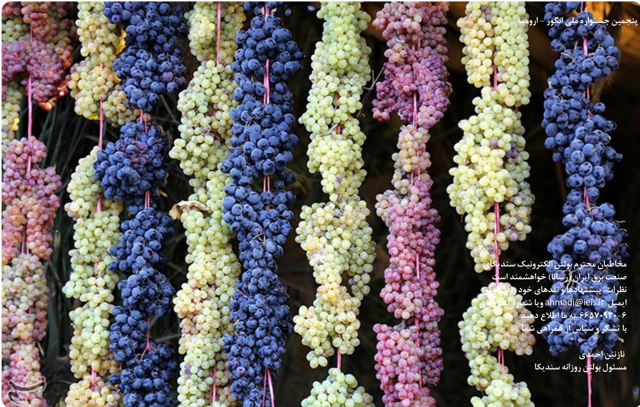
پنجمین جشنواره ملی انگور - ارومیه

مخاطبان محترم بولتن الکترونیک سندیکا صنعت برق ایران (رسانا) خواهشمند است نظرات، پیشنهادات و نقدهای خود را از طریق ایمیل ahmadi@ieis.ir و یا شماره تلفن های ۰۶-۶۶۵۷۰۹۳۰ به ما اطلاع دهید. با تشکر و سپاس از همراهی شما