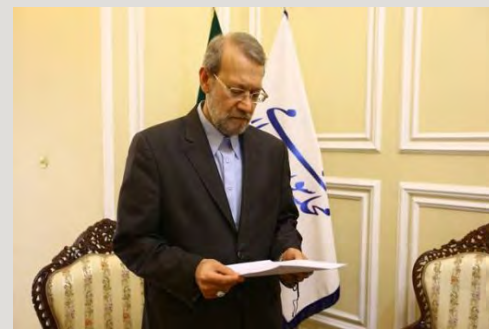
بررسی حقوقی نامه مجلس به دولت در خصوص اصلاح تعرفه‌ها

همچنین تعیین گردید که منابع درآمدی حاصل از افزایش صورت حساب مشترکین آب و برق صرفاً برای تعویض لوازم اندازه‌گیری و مدیریت مصرف، کاهش هدررفت و اصلاح و ... روی شبکه‌های توزیع و خرید آب و برق از بخش خصوصی هزینه شود.