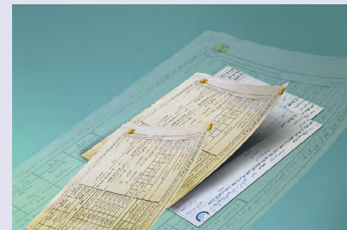
نایب رئیس سندیکای صنعت برق

نایب رئیس سندیکای صنعت برق ایران خاطرنشان ساخت: این افزایش هفت درصد برای عموم و ۱۶ درصدی که پرمصرف محسوب می شوند و گروه سومی که پرمصرف ترین (با سهم یک درصد) هستند تا ۲۳ درصد برای آنها تعرفه پیش بینی شده و این نیز عدد قابل توجهی نسبت به فاصله معنا داری که امروز بین قیمت تمام شده و قیمت تکلیفی است، شامل نمی شود در عین حال این افزایش بار اقتصادی چندانی هم بر روی دوش مصرف