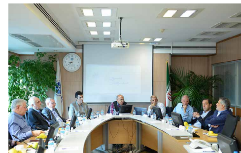
در بیست و ششمین نشست کمیسیون صنعت و معدن اتاق تهران مطرح شد

او سپس با توجه به نقشی که نظام مالی کشور در تأمین نیاز بخش صنعت و معدن ایفا می‌کند، مروری بر وضعیت بازار سرمایه و بانک‌ها در کشور داشت و در نهایت پیشنهاداتی کوتاه‌مدت و بلندمدت، ارائه کرد و گفت: بانک‌ها به‌عنوان واسطه‌گران مالی، منابع را از پس‌اندازکنندگان (غیرآگاه به‌چگونگی سرمایه‌گذاری) جذب می‌کنند و با ضوابط و مقررات خاص در اختیار تولیدکنندگان (توانا در تولید ولی فاقد امکانات مالی) قرار می‌دهند. این امر در یک نظام مالی سالم و کارآمد باعث افزایش دسترسی تولیدکنندگان به منابع مالی، کاهش هزینه تأمین مالی تولید و افزایش رشد و توسعه اقتصادی کشور می‌شود. در مقابل، اگر بانک‌ها در خدمت بخش حقیقی اقتصاد نباشند تعادل بازارها بر هم می‌ریزد و منابع به بخش‌های غیرتوسعه‌ای سوق می‌یابد.