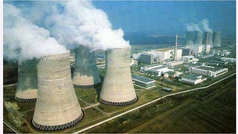
عضو سندیکای صنعت برق ایران هشدار داد:

رئیس سازمان توسعه تجارت ایران ادامه داد: از