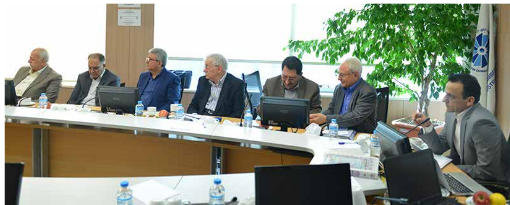
در شانزدهمین نشست کمیسیون بازار پول و سرمایه اتاق تهران مطرح شد