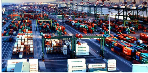
رئیس سازمان توسعه تجارت:

به گزارش ایرنا، در آیین امروز از تعدادی از صادرکنندگان منتخب صندوق ضمانت صادرات ایران با اهدای لوح و جوایز صادراتی قدردانی شد.