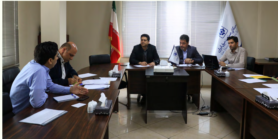
ادامه در صفحه ۲

جلسه کارگروه مجلس سندیکای صنعت برق ایران سی و یکم اردیبهشت سال جاری در محل سندیکا برگزار و راهکارهای مختلف جهت تقویت ارتباط با مجلس بررسی شد.