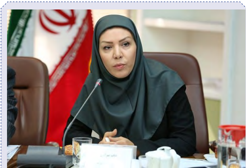
مدیرعامل صندوق ضمانت صادرات ایران خبر داد: