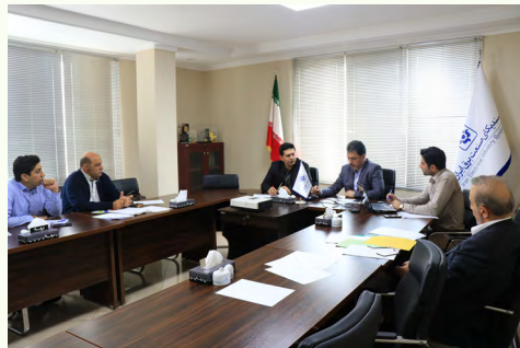
در کارگروه مجلس تاکید شد؛

در ادامه دعوت از نفرات و نمایندگان مرکز پژوهش‌ها، نمایندگان پارلمانی وزارت نیرو و توانیر در جلسات کارگروه با توجه به دسته‌بندی موضوعات از دیگر مواردی بود که در این نشست مورد تاکید قرار گرفت. همچنین مقرر شد موضوعات مربوط به کارگروه مجلس بررسی و همزمان برگزاری جلسه‌ای با گروه برق و انرژی مجلس در دستور کار قرار گیرد و در این نشست موضوع قراردادهای نیمه تمام و اولویت‌بندی پیمان‌ها طرح و بررسی شود. در پایان جلسه مصوب شد افراد حاضر در کارگروه مجلس، موضوعات پیشنهادی خود را برای طرح در جلسات آتی اعلام کنند.