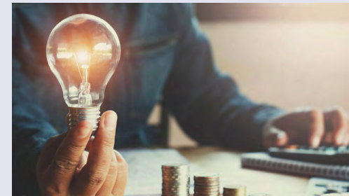
راهکار ساده برای کاهش مصرف برق

بر اساس اعلام وزارت نیرو، وی درباره راهکارهای مشترکان برای قرار نگرفتن در گروه پرمصرف ها نیز توضیح داد: با توجه به اینکه در تابستان وسایل سرمایشی بیشترین میزان مصرف برق را به خود اختصاص می دهند، مشترکان در صورت توجه و دقت در چگونگی استفاده از وسایل سرمایشی، می توانند به میزان زیادی از مصرف برق خود را کاهش دهند.