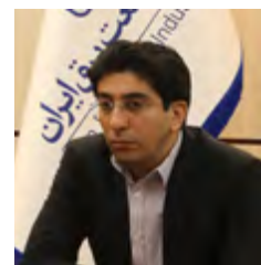
عدم پوشش ریسک ها در فرمت قراردادهای کنونی