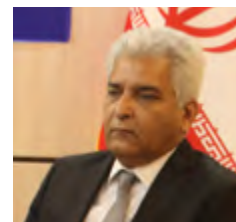
عدم پرداخت مطالبات شرکت ها را به سمت تعطیلی سوق می دهد