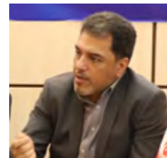
اقتصاد انرژی؛ تعیین نرخ دستوری