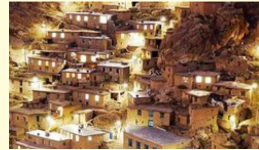
مجری طرح برق‌رسانی روستایی خبر داد:

مجری طرح برق‌رسانی روستایی با تأکید بر اینکه تاکنون ۲۵۰ هزار کیلومتر شبکه به منظور تأمین برق ۲۱,۵ میلیون نفر روستایی ایجاد شده است، افزود: برای سال ۹۸ برق‌رسانی به ۴۰۰ روستا و همچنین توسعه، بهسازی و نگهداری شبکه‌های برق روستایی موجود با اعتباری بالغ بر یک هزار و ۵۰۰ میلیارد تومان در دستور کار قرار گرفته است. چهل‌امیرانی با اشاره به اینکه در حال حاضر جمعیت روستایی برق‌دار در ایران به بیش از ۹۹,۷ درصد رسیده است، ادامه داد: بر اساس اطلاعات سایت آژانس بین‌المللی انرژی، این رقم در آمریکای مرکزی و جنوبی ۸۶ درصد، قاره آسیا ۸۵ درصد، خاورمیانه ۷۸ درصد، آفریقا ۳۶ درصد و به طور کلی در جهان جمعیت روستایی برق‌دار حدود ۷۶ درصد است. از این رو کشور ما در زمینه برق‌رسانی روستایی در شرایط بسیار خوبی قرار دارد.