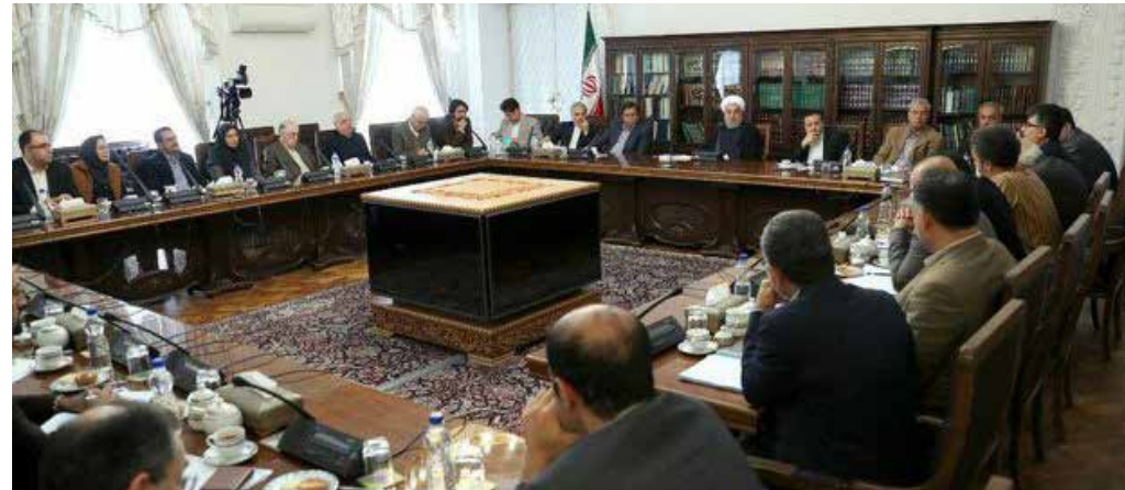
مهر گزارش می دهد؛

در عین حال برخی اقتصاددانان به وضعیت کنونی