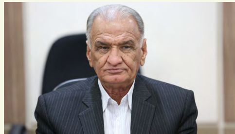
رئیس اتاق بجنورد مطرح کرد

وی مقابله با پدیده قاچاق کالا و جلوگیری از واردات کالاهای مشابه داخلی را از دیگر راهکارهای رونق تولید عنوان کرد و افزود: با جلوگیری از واردات کالای غیرضروری می‌توان علاوه بر ایجاد اشتغال، زمینه رونق تولید و افزایش درآمد اقتصادی را برای کشور فراهم کرد.