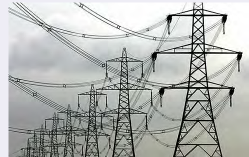
مدیر شرکت توزیع برق بروجرد:

مدیر شبکه توزیع برق بروجرد با اشاره به سیل اخیر گفت: در سیلاب اخیر شهرستان بروجرد جابجایی ۹ کیلومتر شبکه فشار متوسط در کنار رودخانه روستای کرکیخان را داشتیم که انجام شد.