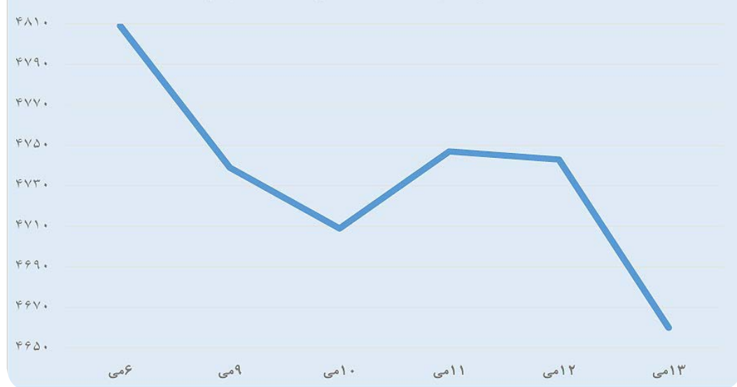
قیمت مس در بازار لندن (هفتگی/دلار در هر تن)

گذشته قیمت مس در بازار لندن از ۴۸۰۲ دلار در هر تن به ۴۶۶۰ دلار کاهش یافته است که حکایت از سیگنال‌های کاهشی به بازارهای مس جهان دارد. روند تغییرات بهای ارز در بازار تهران اما طی این مدت ۴ تومان کاهش یافته است که البته تغییر محسوسی نیست اما همگرایی مولفه‌های کاهنده قیمت را در بازار مس تایید می‌کند. کارشناسان معتقدند هفته جاری از پتانسیل‌های بالایی برای کاهش بیشتر قیمت مس در بازارهای جهانی و بالطبع در بازار داخل برخوردار است و ممکن است قیمت تا ۴ هزار و ۵۰۰ دلار نیز برسد. دلیل این امر نیز انتشار آمارهای نامیدکننده از شاخص خرید مدیران چین است که از پیش‌بینی‌ها پایین‌تر بوده است.