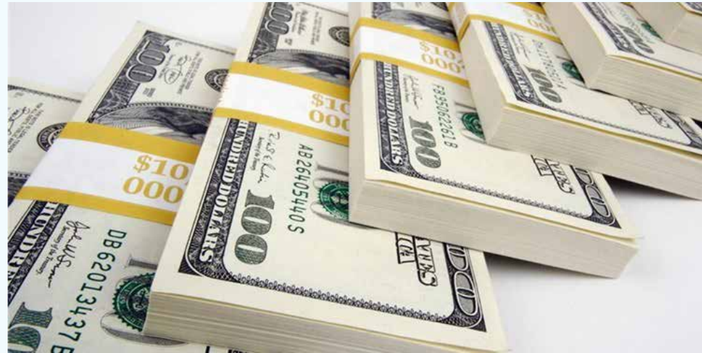
معاون سازمان برنامه و بودجه: