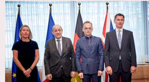
فدریکا موگرینی در پایان نشست وزرای خارجه اروپایی اعلام کرد