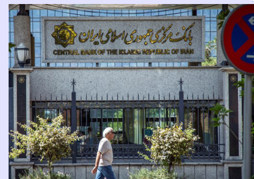
یادداشت مشاور سابق اوفک

اما تحریم جدید چگونه عمل خواهد کرد؟ در سال ۲۰۰۰ قانونی تحت عنوان «قانون اصلاح تحریم‌ها و افزایش صادرات» در کنگره آمریکا به تصویب رسید که به موجب آن دفتر کنترل دارایی‌های خارجی (اوفک) موظف شد برخی اقلام بشردوستانه (غذا، دارو و لوازم پزشکی) را از برنامه تحریم کشورهای تحت تحریم آمریکا از جمله ایران حذف کند. در ارتباط با تحریم‌های ایران، این کار از طریق صدور مجوزهای عمومی (معافیت) انجام می‌شود و در قالب آن هیچ فرد یا نهاد ایرانی که ذیل تحریم‌های مبارزه با تروریسم قرار داشته باشد، نمی‌تواند از این معافیت استفاده کند.