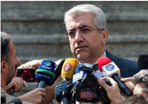
وزیر نیرو در حاشیه جلسه هیئت دولت خبر داد: