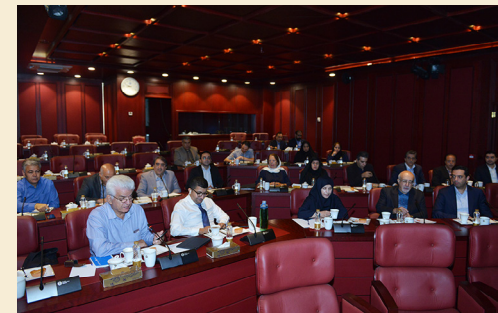
در ششمین نشست کمیسیون تسهیل تجارت و توسعه صادرات اتاق بازرگانی تهران مطرح شد