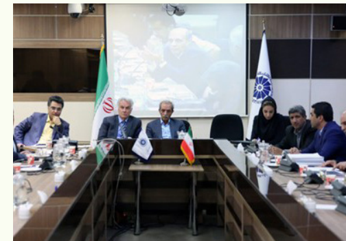
در نشست روسای کمیسیون‌های اتاق ایران مطرح شد