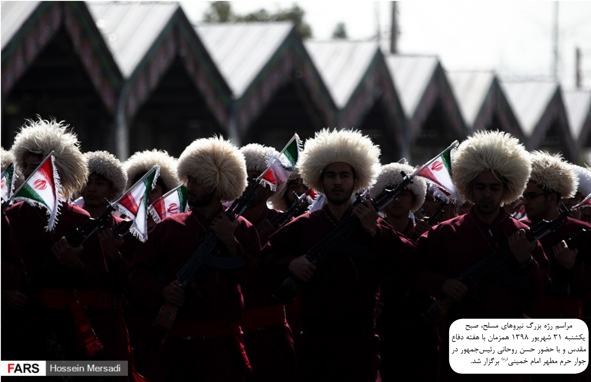
مراسم رژه بزرگ نیروهای مسلح، صبح یکشنبه ۳۱ شهریور ۱۳۹۸ همزمان با هفته دفاع مقدس و با حضور حسن روحانی رئیس‌جمهور در جوار حرم مطهر امام خمینی (ره) برگزار شد.