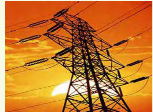
دفتر بودجه و توسعه سرمایه‌گذاری توانیر اعلام کرد:

قابل ذکر است: دفتر بودجه و توسعه سرمایه‌گذاری توانیر با ارایه گزارش منابع و مصارف صنعت برق طی برنامه ششم توسعه به مراجع ذیربط و تلاش برای کاهش شکاف میان قیمت تمام شده و قیمت تکلیفی فروش برق، ضمن فراهم آوردن زمینه اصلاح جزیی در تعرفه‌های برق، همراهی مراجع تصمیم‌گیری در زمینه اصلاح قیمت برق در مقاطع بعدی را نیز فراهم ساخته است.