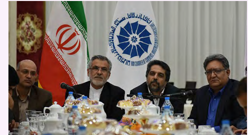
در نشست فعالان اقتصادی استان خراسان جنوبی با سفیر ایران در افغانستان مطرح شد

موهبتی افزود: دولت افغانستان قول داده که گمرک یزدان را در نیمه نخست سال ۹۸ راه اندازی کند که باید این موضوع با جدیت پیگیری شود.