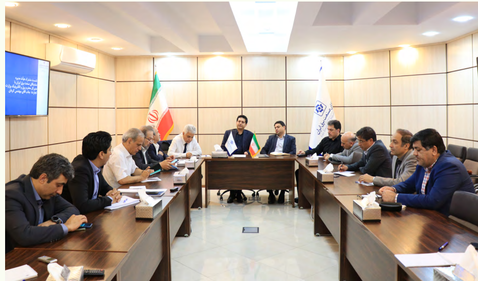
متن کامل در صفحه ۲

در ابتدای چهل و هشتمین جلسه دوره هفتم هیات‌مدیره سندیکای صنعت برق ایران که دوازدهم خرداد سال جاری در محل سندیکا برگزار شد، گزارشی از اقدامات صورت گرفته توسط دبیر سندیکا ارائه شد.