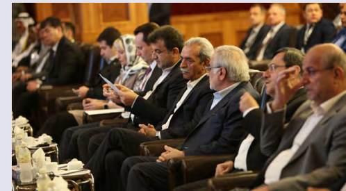
در مجمع عمومی مؤسس اتاق مشترک ایران و ویتنام تصریح شد

بر اساس اظهارات وی تلاش برای حل‌وفصل مسائل مربوط به نقل و انتقالات مالی و طراحی مکانیزم ویژه در این حوزه، تسهیل روابط با ایجاد تسهیلات