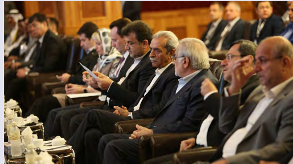
رئیس اتاق ایران در اجلاس اتاق های بازرگانی حاشیه دریای خزر

رئیس اتاق ایران افزود: باید بازنگری در تجارت و روابط اقتصادی کشورهای حاشیه خزر صورت گیرد تا موانع و نواقص برطرف شود، زیرا زینده نیست که با توجه به توان تولید و تجارت منطقه، نیاز های کشورها و مردم حاشیه خزر در جایی دیگر