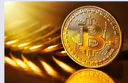
نایب رئیس سندیکای صنعت برق ایران: