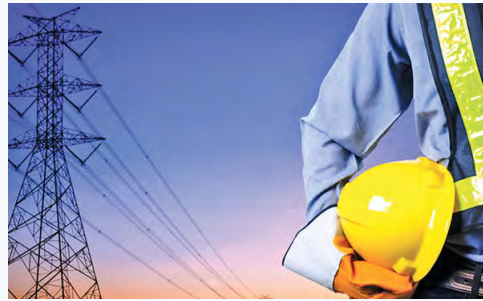
آژانس بین‌المللی انرژی با بررسی آمار سال ۲۰۱۸ منتشر کرد