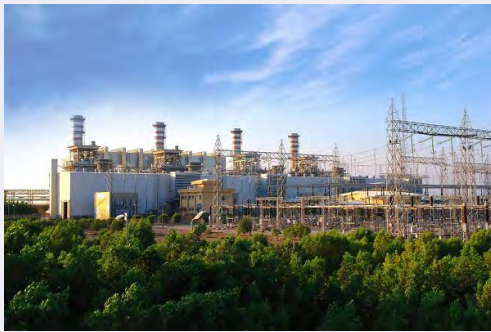
مدیرعامل شرکت توانیر:

به گفته این مقام مسئول ظرف چند روز آینده طرح خنک کاری هوای ورودی دو واحد از نیروگاه زاگرس نیز به ظرفیت ۳۰ مگاوات به بهره برداری خواهد رسید که با افتتاح سه طرح یاد شده جمعاً ۳۵۰ مگاوات به ظرفیت تولید برق کشور اضافه می شود.