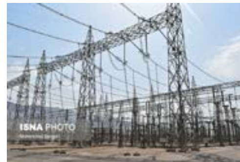
با تدوین برنامه ویژه محقق شد

هرگونه آیین نامه، دستورالعمل یا بخشنامه یا مقرر مرتبط با محیط کسب و کار باید بلافاصله در پایگاه اطلاعات قوانین و مقررات مرتبط با محیط کسب و کار معاونت حقوقی رئیس جمهور ثبت شود و به اطلاع عمومی برسد. با توجه به ذیل ماده ۳۰ قانون فوق‌الذکر که در تاریخ ۲۸ اردیبهشت سال ۱۴۰۱ لازم الاجرا شده است، مقررات مرتبط با محیط کسب و کار پس از یکسال از تاریخ مذکور تنها در صورت ثبت در پایگاه موضوع این ماده نافذ است.