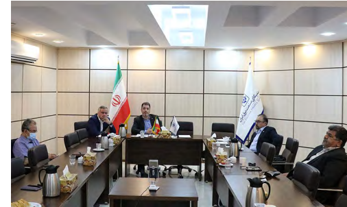
در جلسه هیات مدیره مطرح شد؛

در بخش دیگری از جلسه، ارتباط مجازی با یکی از نمایندگان مجلس شورای اسلامی برقرار و چالش‌های بخش خصوصی صنعت برق اعم از کمبود منابع مالی، انباشت مطالبات، قراردادهای صادرات، اقتصاد برق، زنجیره تامین، توسعه نامتوازن صنعت برق و ... منعکس شد. بنا شد برای طرح و بررسی این موضوعات جلسه‌ای با وزارت اقتصاد و کمیسیون‌های تخصصی مجلس برگزار و از اعضای سندیکا در این جلسات دعوت به عمل آید.