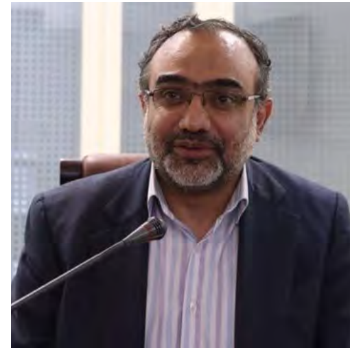
معاون وزیر نیرو:

۴۵ هزار مگاوات تفاهم نامه انرژی های تجدیدپذیر امضا شد معاون وزیر نیرو در امور تجدیدپذیر ها گفت: در ماه های گذشته فراخوان نیروگاه های تجدید پذیر دادیم که ۹۵ هزار مگاوات ارسال شد و با ۴۵ هزار مگاوات تفاهم نامه امضا شد.