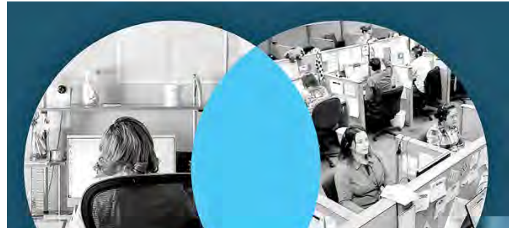
چارچوب چهار مرحله‌ای برای تعادل و هماهنگی بین دور کاری و حضور فیزیکی