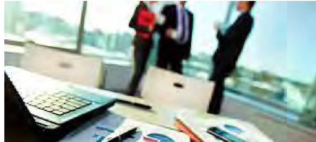
مفاهیم کاربردی مدیریت