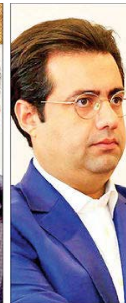
سعید اسلامی‌بیدگلی دبیرکل کانون نهادهای سرمایه‌گذاری ایران