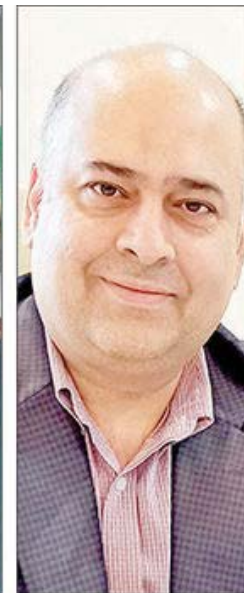
حمیدرضا دانش‌کاظمی عضو شورای عالی بورس و اوراق‌بهدار