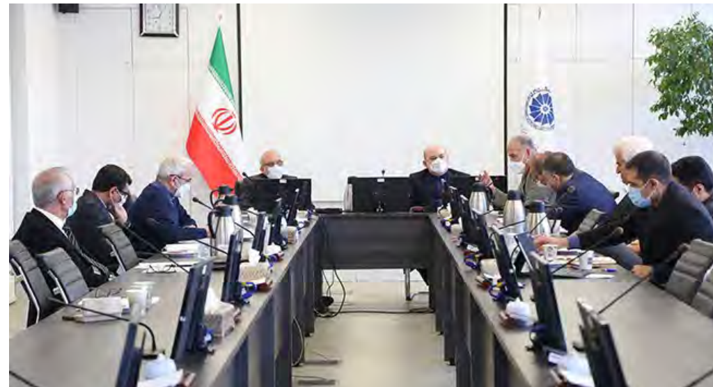
در نشست شورای راهبری تأکید شد

قانون مربوط به جذب سرمایه‌گذاری خارجی بازنگری شود در تازه‌ترین نشست شورای راهبری بهبود محیط کسب‌وکار، حاضران بر ضرورت بازنگری و اصلاح قانون مربوط به جذب سرمایه‌گذاری خارجی و همچنین تعریف مشوق‌های مناسب برای سرمایه‌گذاری در ایران تأکید کردند.