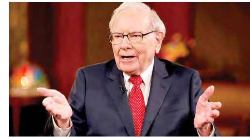
راز موفقیت «وارن بافت»

کار آفرین مشهور آمریکایی و مرد ثروتمند جهان، راز موفقیت خود را «کارکنان عاشق» عنوان می‌کند. «وارن بافت» می‌گوید: استخدام نیروهایی که در درجه اول «صداقت» و در عین حال «هوش بالا» و «انرژی فراوان» دارند، می‌تواند کسب و کار را به نتایج مثبت برساند. اما این، همه چیز نیست. مدیرانی که «آزادی عمل» کارکنان و «هدف محوری» را بر «مدیریت ذره‌بینی» ترجیح می‌دهند، محیط کار را برای «عشق به کار» فراهم می‌کنند.