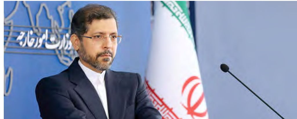
سخنگوی وزارت خارجه با اشاره به تنفس در دور هشتم مذاکرات مطرح کرد