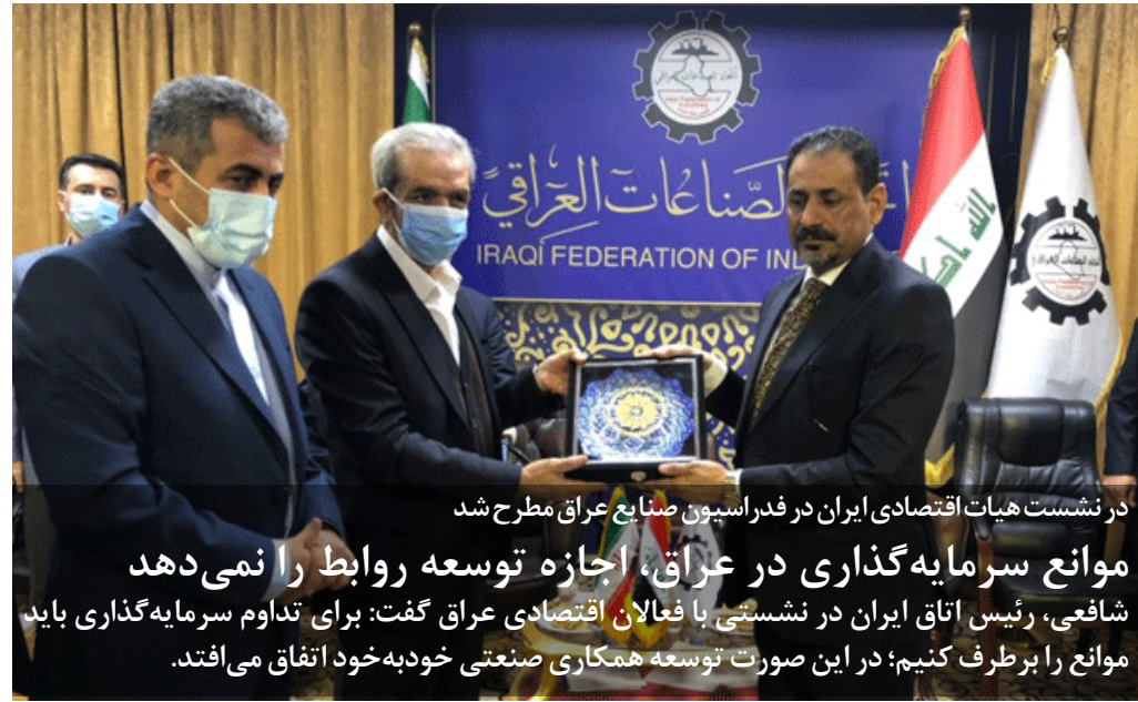
در نشست هیات اقتصادی ایران در فدراسیون صنایع عراق مطرح شد

رئیس اتاق صنایع عراق گفت: در زمینه تأمین مواد اولیه آماده همکاری هستیم همچنین ۶ شهرک صنعتی در عراق داریم که فرصت‌های سرمایه‌گذاری در آن فراهم است. پیشنهادهای زیادی از کشورهای مختلف دادیم. در حال حاضر با اردن در حال همکاری هستیم. علاقه داریم این همکاری با ایران شکل بگیرد و شهرک صنعتی مشترکی با ایران داشته باشیم. آماده هستیم تا بازسازی و توسعه عراق را با کمک ایران دنبال کنیم.