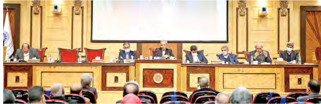
بخش خصوصی بررسی کرد؛ جاماندگی ایران از رالی روابط تجاری دوجانبه در منطقه