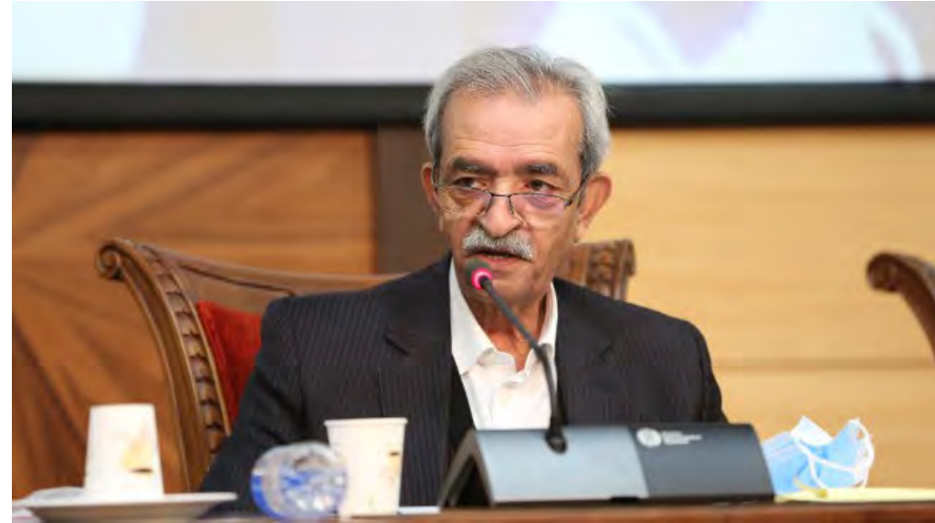
متن کامل سخنرانی غلامحسین شافعی در نشست هیئت نمایندگان

سومین وجه به ساختار تأمین درآمدها و به طور مشخص به بحث مالیات در بودجه بازمی‌گردد. در لایحه بودجه که توسط دولت تدوین شده است شاهدیم که مالیات بر شرکت‌های غیردولتی با رشد ۱۴۶ درصدی به میزان ۱۱۲,۱ هزار میلیارد تومان برآورد شده است. در مقابل برای شرکت‌های دولتی تنها با رشد ۸۳ درصد نسبت به سال قبل مبلغ ۷,۵ هزار میلیارد تومان هدف‌گذاری شده است. به علاوه برای مالیات بر ارزش افزوده که مستقیم مردم و کسب‌وکارها را تحت تأثیر قرار می‌دهد رشد ۷۰ درصدی پیش‌بینی شده است. این اعداد نشان‌دهنده آن است که بار اصلی درآمدهای مالیاتی دولت در سال آینده بر دوش بخش خصوصی قرار داده شده است. در کنار این افزایش فشار بر بخش خصوصی