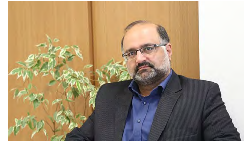
مدیر مرکز آمار اتاق ایران