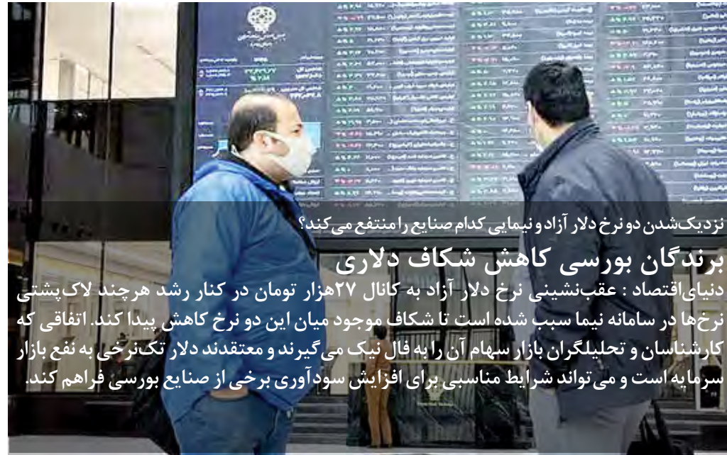
نزدیک شدن دو نرخ دلار آزاد و نیمایی کدام صنایع را منتفع می‌کند؟