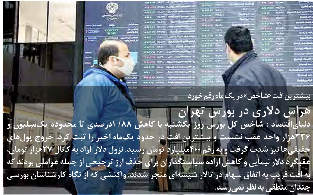
بیشترین افت «شاخص» در یک ماه رقم خورد