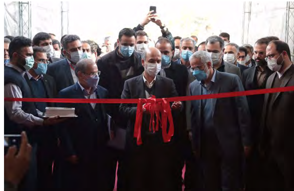
با حضور وزیر نیرو؛

وی افزود: شرایط کویت نسبت به دیگر کشورهای حوزه خلیج فارس بسیار متفاوت است؛ در دیگر کشورها از جمله امارات، قطر یا عمان به راحتی می‌توان برای سیاحت، گردش یا تجارت ویزا گرفت. اما در مورد کویت گرفتن ویزا کمی سخت است. ما در این رابطه وزارت امور خارجه و همچنین