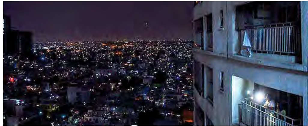
سخنگوی صنعت برق:

البته حتی همین حالا هم با ورود به زمستان، آژیر قطع برق به دلیل ضرورت تامین گاز اقصی‌نقاط کشور به صدا درآمده، به طوری که شرکت توزیع برق استان تهران با انتشار اطلاعیه‌ای از احتمال