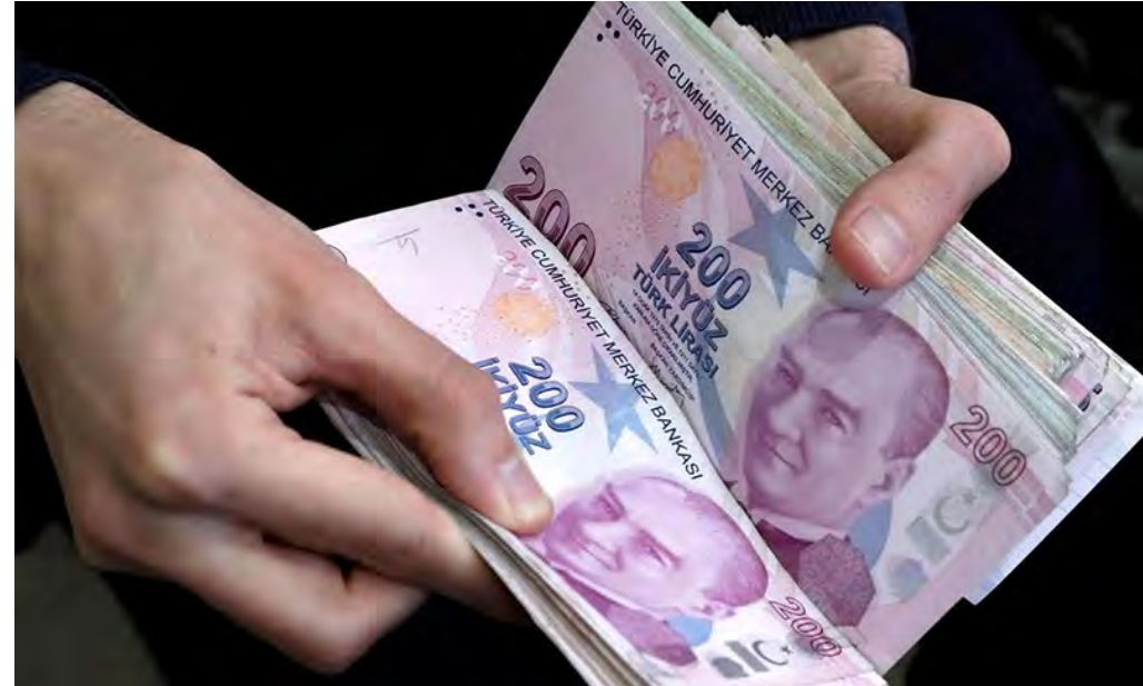
رئیس کمیسیون تسهیل تجارت و توسعه صادرات اتاق تهران همزمان با سقوط شدید لیر هشدار داد