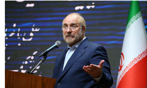
در مراسم گرامیداشت هفته پژوهش