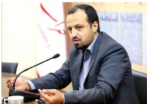
حذف ارز دولتی تکلیف قانونی است / ۲ عامل تورم از زبان وزیر اقتصاد

وزیر اقتصاد در پاسخ به سؤالی درباره قانون رمزارزها گفت: در کشور نمی‌توانیم چشم خود را بر این پدیده ببندیم و باید در برابر آن مواجهه فعالانه و تعیین مقررات داشته باشیم که کمیته تصمیم‌گیری در حال تهیه پیش‌نویسی در این‌باره است.