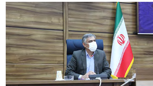
از سوی شورای گفت‌وگوی خراسان شمالی پیشنهاد شد