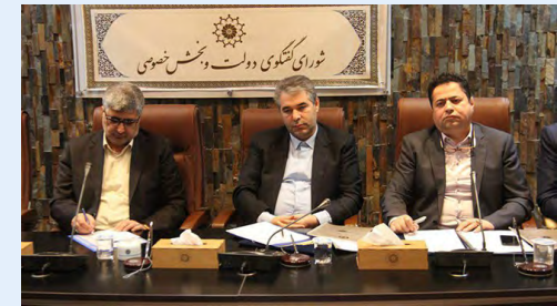
با حضور بیش از ۱۰۰ مهمان از ۱۵ کشور

ی بیان کرد: هماهنگی‌های لازم در استان در جهت میزبانی شایسته از دومین اجلاس بین‌المللی کشورهای عضو اکو انجام یافته و برنامه‌ریزی‌های لازم در جهت هماهنگی بین دستگاه‌های اجرایی استان انجام شده است.