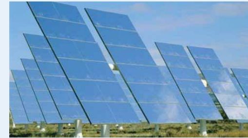
استاندار همدان مطرح کرد:

وی در پایان گفت: یک میلیارد و ۴۲۶ هزار تومان تسهیلات تکلیفی از بانک‌ها برای توسعه و اشتغال روستایی و شهری جذب شده و در زمینه اشتغال روستایی همدان به عنوان استان اول شناخته شده است.