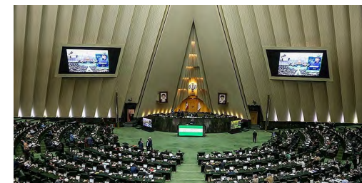
انتقاد رئیس کمیسیون حمایت قضایی و مبارزه با فساد اتاق تهران از تصویب کلیات طرح مدیریت تعارض منافع