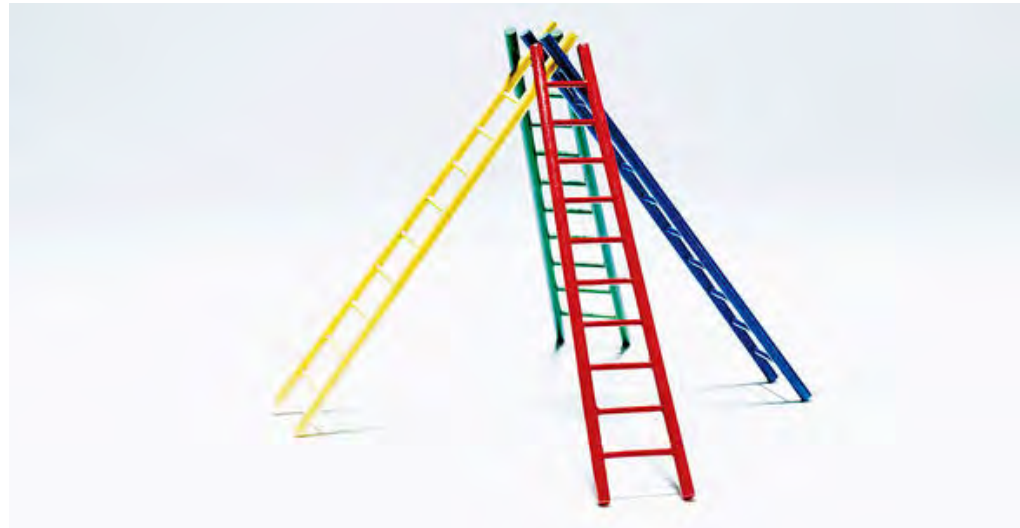
امنیت روانی و نقش مهم رهبری سازمانی

رهبران سازمانی می‌توانند با ایجاد محیط، طرز فکر و رفتار مناسب در تیم‌های خود، امنیت روانی را ایجاد کنند. بر اساس تجربیات ما، کسانی که این کار را به بهترین نحو ممکن انجام می‌دهند، عموماً به عنوان کاتالیزور عمل کرده و با توانمندسازی سایر مدیران تیم (حتی آنهایی که اختیارات رسمی ندارند) در الگوبرداری از نقش و تقویت رفتارهایی که از بقیه اعضای تیم انتظار دارند، به ترویج امنیت روانی کمک می‌کنند. تحقیقات ما نشان داده که جو مثبت و محیط دوستانه تیمی که در آن هم‌تیمی‌ها برای مشارکت یکدیگر ارزش قائلند، به رفاه و سلامت یکدیگر اهمیت می‌دهند و به روال انجام کار اشراف دارند، از مهم‌ترین محرک‌ها در امنیت روانی تیم‌هاست. مدیران تیم با تعیین و القای جو مثبت تیمی از طریق اقدامات خود، بیشترین تاثیر را بر امنیت روانی تیم می‌گذارند. علاوه بر این، ایجاد این جو مثبت می‌تواند در زمان بروز مشکل یا اختلال، سود مضاعف به سازمان برساند. تحقیقات نشان می‌دهد که جو مثبت تیمی در دوران پاندمی کووید-۱۹، تاثیری به مراتب قوی‌تر بر امنیت روانی تیم‌هایی که به‌واسطه دورکاری تغییرات بیشتری را تجربه کرده‌اند نسبت به تیم‌هایی که کمترین تغییر را در روال کاری خود داشته‌اند، گذاشته است. این درحالی است که فقط ۴۳ درصد از شرکت‌کنندگان در این تحقیق از جو مثبت تیمی خود گزارش داده‌اند. در دوران پاندمی ما شاهد چرخشی سریع از سبک سنتی فرمان