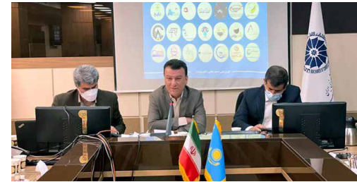
درسمینار بررسی فرصت‌های تجاری در قزاقستان مطرح شد

چین و روسیه رقیب ایران در ورود به بازار قزاقستان روسیه ۳۵ درصد، چین ۱۷ درصد و کره جنوبی ۱۳ درصد از نیازهای وارداتی قزاقستان را تأمین می‌کنند و کار ایران برای ورود به بازار این کشور چندان آسان نیست.