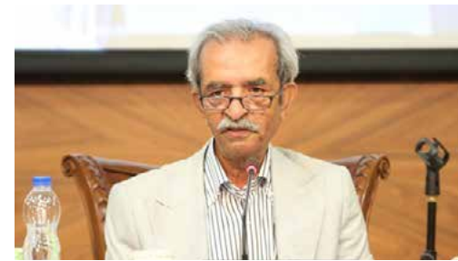
شافعی در شانزدهمین نشست هیات نمایندگان اتاق ایران