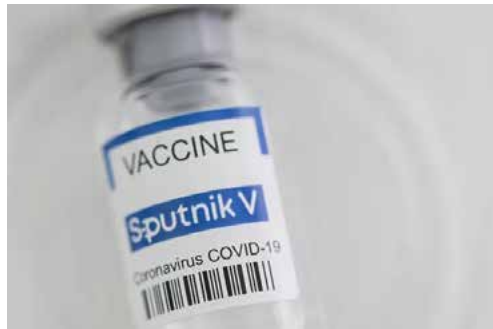
رئیس دانشگاه علوم پزشکی استان زنجان:

وی در رابطه با علت نبود واکسن پاستور در مراکز واکسیناسیون استان، خاطرنشان کرد: به دلیل مشکلاتی در ثبت، این واکسن در حال حاضر موجود نیست ولی مشکلی در تامین واکسن برکت به میزانی که شهروندان خواهان دریافت آن هستند، نداریم.