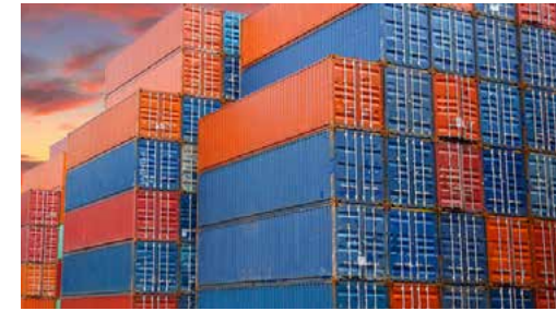
از سوی اتاق ایران اعلام شد

همچنین بر اساس تصمیم نشست ۲۱۳ شورای عالی هماهنگی ترابری کشور در تاریخ ۲۵ آذرماه سال ۱۳۹۸، مصوب شده بود: «حق توقف کانتینرهای وارده یا ترانزیت ورودی به کشور بر اساس توافق میان گیرنده کالا و خط کشتیرانی تعیین می‌شود. در این خصوص، شرکت‌های کشتیرانی موظف هستند میزان حق توقف کانتینر را طی قرارداد مکتوب با گیرنده کالا مشخص کنند. در صورت عدم وجود قرارداد، حق توقف کانتینر بر مبنای تعرفه (صفحه ۱ - صفحه ۲ - صفحه ۳) ریالی خواهد بود که در مهرماه هر سال به طور مشترک توسط انجمن کشتیرانی و خدمات وابسته و انجمن شرکت‌های حمل‌ونقل بین‌المللی ایران و پس از تایید اتاق ایران پیشنهاد و با تایید کمیسیون ماده ۲۰ مصوبه ۱۴۷-۱۴۶ شورا و ظرف سه ماه پس از تایید کمیسیون یادشده قابل اجرا است».