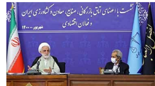
رئیس قوه قضائیه در دیدار با هیات رئیسه اتاق ایران