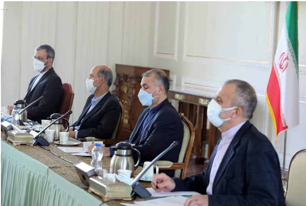
در نشست مشترک وزیران امور خارجه و نیرو؛