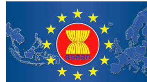
در ماهه نخست امسال؛

گفتنی است، در سوم مرداد ۱۳۹۷ بود که ایران و ۱۰ کشور عضو اتحادیه جنوب شرق آسیا از جمله اندونزی، فیلیپین، سنگاپور، تایلند، ویتنام، برونئی، لائوس، مالزی، میانمار و کامبوج در چهل و نهمین اجلاس خود که به میزبانی لائوس برگزار شده بود، اسناد الحاق ایران به پیمان مودت و همکاری جنوب شرق آسیا تحت عنوان «تاک» را امضا کردند و در واقع، امضای این اسناد سبب شد ایران رسماً با پیوستن به این اتحادیه بتواند از ظرفیت‌های پنجمن قدرت اقتصادی دنیا در جهت تقویت توانمندی‌های اقتصادی خود بهره جوید.