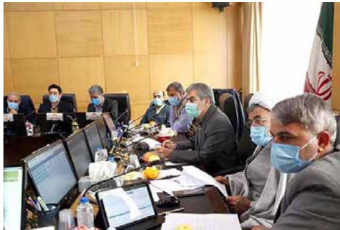
رئیس کمیسیون انرژی مجلس خبر داد

وی در ادامه تاکید کرد: طبق توافقات انجام شده، مقرر شد وزارت نیرو برنامه کوتاه مدت یک ساله برای عبور از زمستان و تابستان آینده و برنامه میان مدت که چند ساله خواهد بود به مجلس ارائه کند. همچنین علی اکبرمحرابی‌ان وزیر نیرو نیز در جمع خبرنگاران با اشاره به مباحث مطروحه در این نشست بیان کرد: در خصوص برنامه‌ها و اولویت‌های وزارت خانه در حوزه‌های برق، فاضلاب و آب توضیحاتی به نمایندگان ارائه شد. همچنین مشکلاتی که در اثر قطع برق در چند ماه گذشته رخ داده بود و مسائلی که درباره آب و خشکسالی و دغدغه‌های که در این زمینه وجود دارد و برنامه‌های که در این زمینه تدوین شده بود را در این جلسه تقدیم کمیسیون انرژی کردیم. سعی می کنیم با اصلاح برخی پروژه‌ها نقطه نظرات مجلس به شکل مطلوب عملیاتی شود.