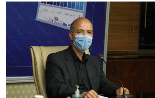
وزیر پیشنهادی نیرو در جمع معاونان و مدیران ارشد صنعت آب و برق کشور:

این گزارش می‌افزاید، در ادامه این جلسه، معاونان بخش‌های مختلف وزارتخانه به ارائه گزارش آخرین وضع موجود پروژه‌ها در زمینه آب، برق و فاضلاب پرداختند.