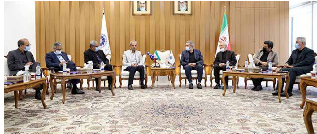
نشست مشترک وزیر پیشنهادی و هیئت رئیسه اتاق ایران برگزار شد