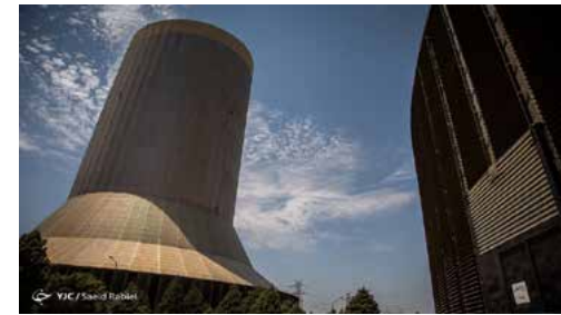
مدیرکل بهسازی نیروگاهها و محیط زیست شرکت برق حرارتی: