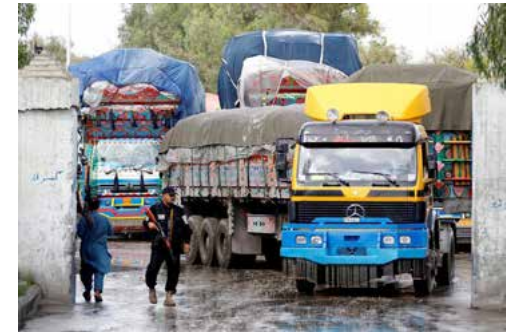
رئیس اتاق بازرگانی مشترک ایران و افغانستان خبر داد