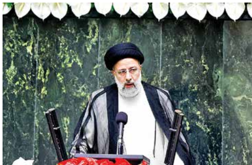
ابراهیم رئیسی در آیین تحلیف ریاست جمهوری: تحریم‌ها باید لغو شود