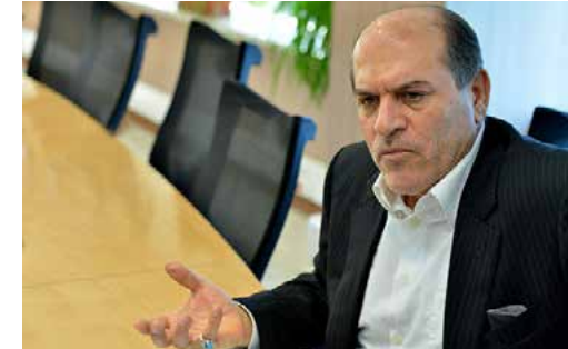
رئیس کمیسیون اقتصاد سلامت اتاق بازرگانی تهران تشریح کرد

او با بیان اینکه با ورود شرکت سرم‌سازی شهید قاضی به چرخه تولید تا پایان مردادماه، احتمالاً مساله کمبود سرم در بازار کمرنگ شود، گفت که راه‌حل اساسی مقابله با قاچاق معکوس، حذف ارز ترجیحی در حوزه دارو و تعیین قیمت واقعی برای فرآورده‌های دارویی است.